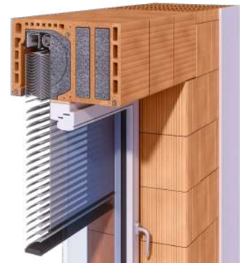
Ziegel-Rollladenkasten mit Raffstore

Mit aufwendigen Dämmarbeiten nach dem Versetzen auch für den Neubau mit massiven Ziegelwänden geeignet. Bietet weniger Flexibilität bei der Ausstattung mit Sonnen- und Insektenschutz.