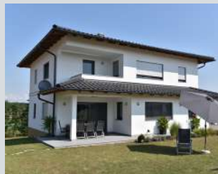
Ziegel-Rollladenkästen mit Sonnenschutz