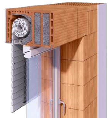
Ziegel-Rollladenkasten mit Rollladen