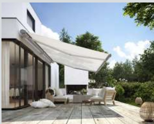
Markisen und Textiler Sonnenschutz