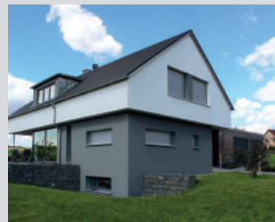
Vorbau und Unterputzkästen mit Rollläden oder Raffstore